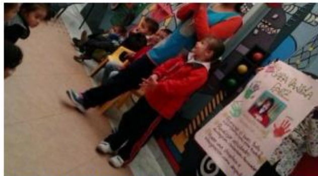
Fotografía de la actividad (Fuente: Autora de la investigación).