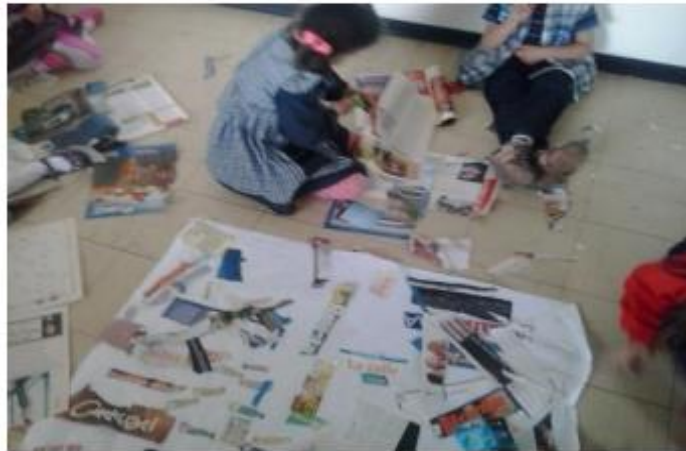
Fotografía de la actividad