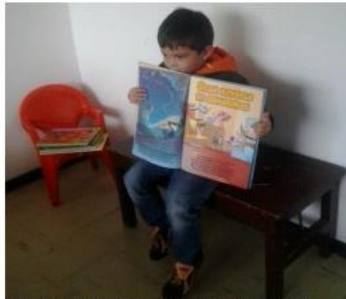
Fotografía de la actividad (Fuente: Autora de la investigación).