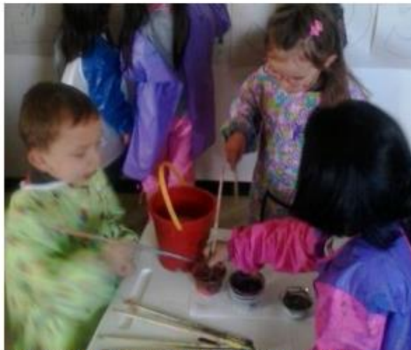
Fotografía de la actividad.