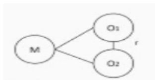
Diagrama de correlación